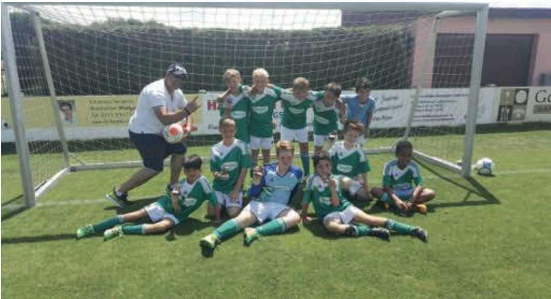
E3 nach Turniersieg bei Johannis 88