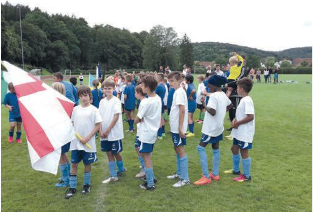
E1 in Treuchtlingen - England beim EM Turnier III