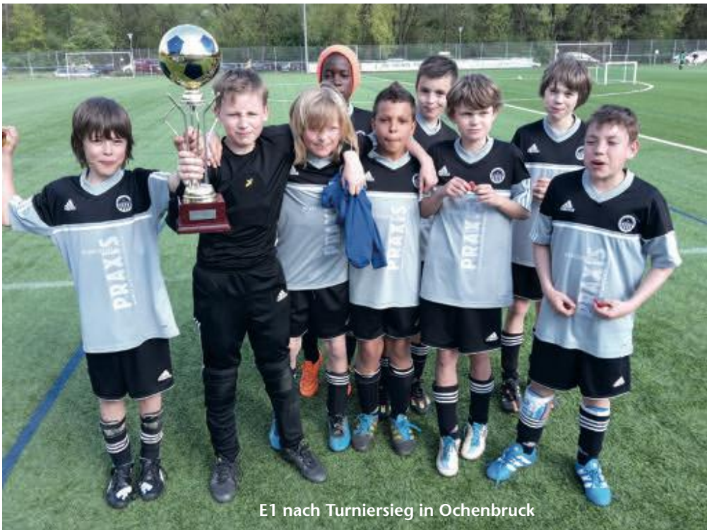
E1 nach Turniersieg in Ochenbruck

In der nächsten Saison dürfen die 33 (!) 2005er Jungs in die D-Jugend. Dort brauchen wir pro Mannschaft 2 Kinder mehr. Damit auch wieder alle spielen können haben wir nicht nur eine D2 und D3 gemeldet, sondern zusätzlich auch ein D4, die dann weiterhin auf Kleinfeld (5+1) spielen wird. Jedoch wird diese Mannschaft im Verbund mit der D3 zusammen ein großes Team bilden, das wir dann flexibel aufteilen werden. >>>